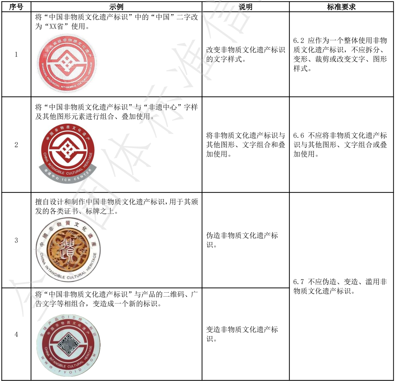
表 A.2 非物质文化遗产标识错误使用示例