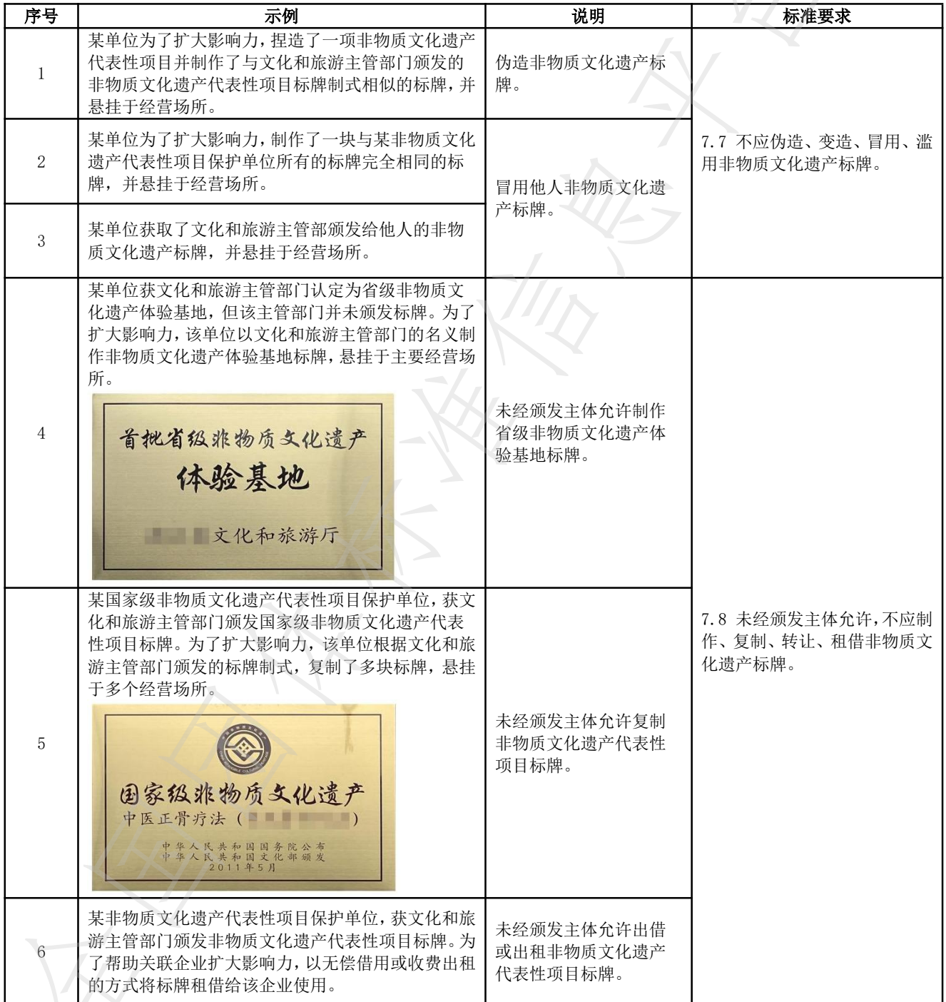
表 A.3 非物质文化遗产标牌错误使用示例