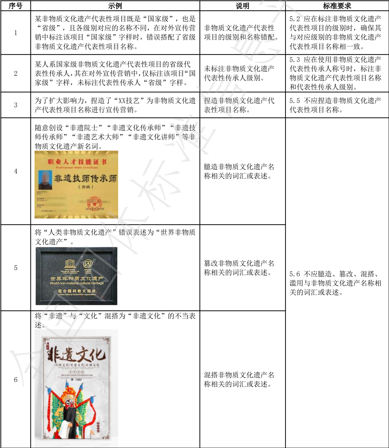
表 A.1 非物质文化遗产名称错误使用示例